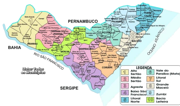
Figura 1 - Estado de Alagoas

Ainda, de acordo com o censo de 2010, o Estado de Alagoas tem uma população de aproximadamente 3,1 milhões de habitantes, contando com 102 municípios, tendo Maceió (932748 hab.), Arapiraca (214006 hab.), Palmeira dos Índios (70368 hab.), Rio Largo (68481 hab.), União dos Palmares (62358 hab.), Penedo (60378 hab.), São Miguel dos Campos (54577 hab.), Coruripe (52130 hab.) e Campo Alegre (50816 hab.) (IBGE, 2010), como os mais populosos.